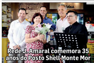
Rede J. Amaral comemora 35 anos do Posto Shell Monte Mor

Na tarde da última terça-feira (18), a Rede J. Amaral promoveu um evento especial para celebrar os 35 anos do Posto Shell localizado na margem da SP-101, no Jardim Bela Vista, em Monte Mor. A comemoração reuniu autoridades municipais, lideranças locais e moradores da região, marcando um dia de homenagens e reconhecimento pela trajetória do posto que se tornou referência ao longo de mais de três décadas.