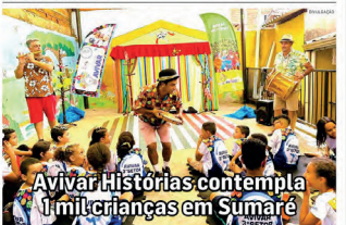
Avivar Histórias contempla 1 mil crianças em Sumaré