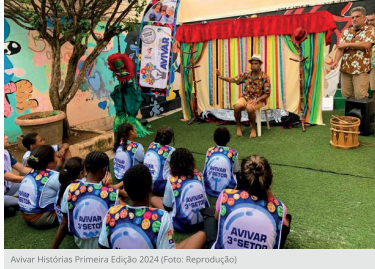
Avivar Histórias Primeira Edição 2024.

Projeto contemplado pelo ProAC promove contações de histórias e distribui HQs em bairros vulneráveis da cidade. Publicado em 21/11/2025 às 09:42