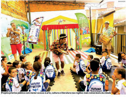
Projeto prioriza público com menor acesso à arte, cultura e literatura nas regiões mais vulneráveis da cidade