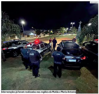
Intervenções já foram realizadas nas regiões de Maria e Maria Antonia

Na tarde da última terça-feira (18), a Rede J. Amaral promoveu um evento especial para celebrar os 35 anos do Posto Shell localizado na margem da SP-101, no Jardim Bela Vista, em Monte Mor. A comemoração reuniu autoridades municipais, lideranças locais e moradores da região, marcando um dia de homenagens e reconhecimento pela trajetória do posto que se tornou referência ao longo de mais de três décadas.