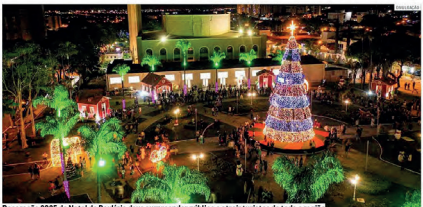
Decoração 2025 do Natal de Paulínia deve surpreender público e atrair turistas de toda a região.

Contrato foi firmado pela gestão para implantação de estrutura natalina na cidade, com montagem, manutenção e segurança; cidade tem como meta virar polo regional de eventos; medida movimenta a economia e ajuda empreendedores