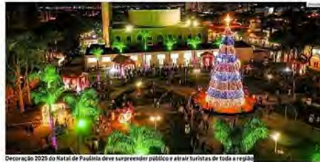
Decoração 2025 do Natal de Paulínia deve surpreender público e atrair turistas de toda a região.

Contrato foi firmado pela gestão para implantação de estrutura natalina na cidade, com montagem, manutenção e segurança; cidade tem como meta virar polo regional de eventos; medida movimenta a economia e ajuda empreendedores