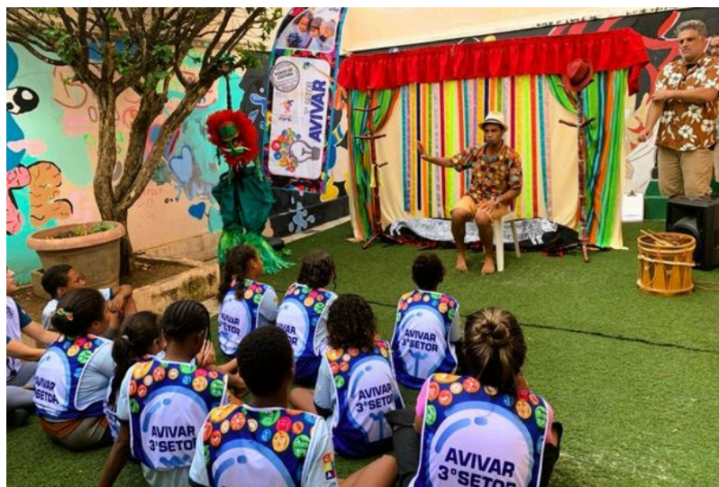
Avivar Histórias Primeira Edição 2024